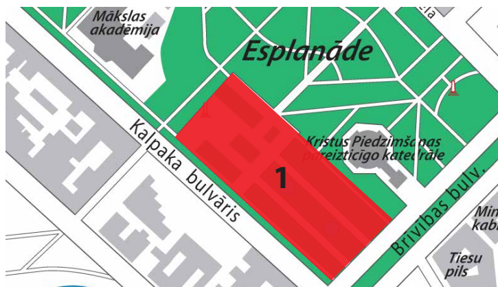
1. PASĀKUMA NORISES VIETA

Noteikumiem tirdzniecības vietu iekārtošanai un darbībai pasākumā Drošības festivāls “Piedzīvojumu vasara” Rīgā, Esplanādē 2017. gada 3. jūnijā no plkst.12:00 līdz plkst.18:00